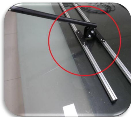
圖四、黑色 A 端支架中心位置距離邊緣約 20 公分左右鎖在橫桿上固定完成