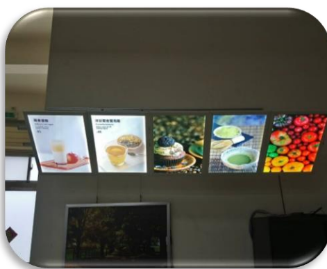
圖十一、掛上燈箱，完工