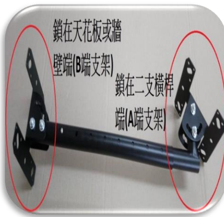
圖二, 支架 A 端鎖在橫桿, B 端鎖在天花板或牆壁