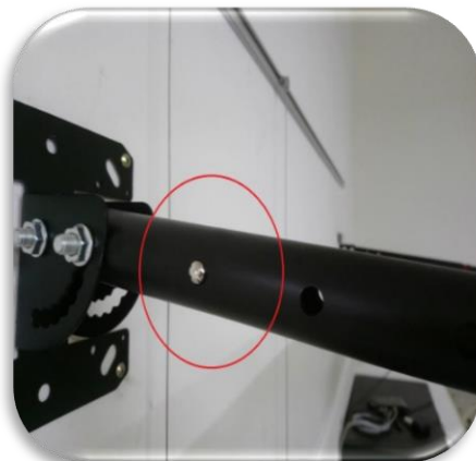
圖九、紅色框內按鈕可調整 掛架高度(深度)