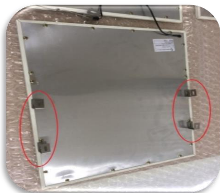
圖十、將已裝好 U 型掛鉤的燈 箱依序放在圖八橫桿上