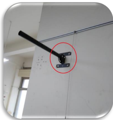
圖七、紅色框內 B 端支架 固定在天花板或牆壁適當