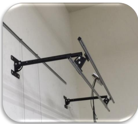
圖八、將圖四黑色 A 端支架套 入圖七黑色 B 端支架套管