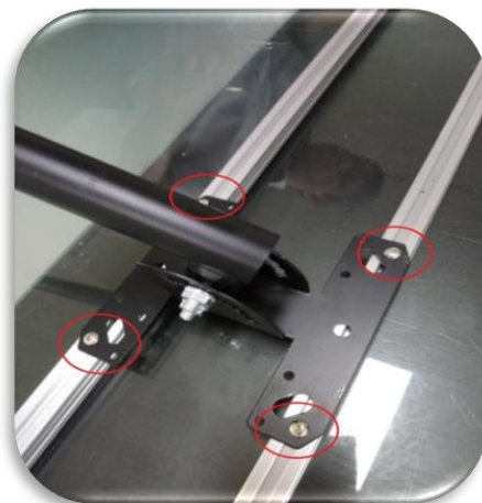
圖三、黑色 A 端支架鎖在 2 支橫桿上, 螺絲請鎖在最外側螺絲孔