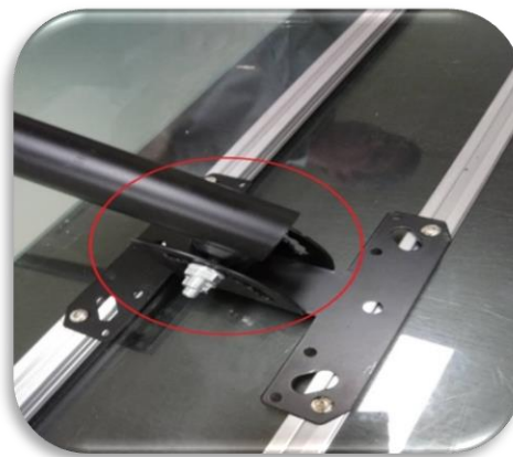
圖六、黑色 A 端支架螺絲取出可調整角度