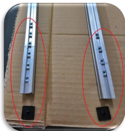
圖四、1支橫桿裝6個螺帽(多出二顆預備鎖電源), 另1支橫桿裝4個螺帽, 蓋好邊蓋