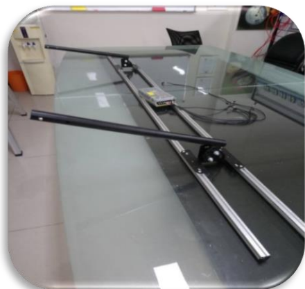
圖七、黑色A端支架中心位置距離邊緣約20公分左右鎖在橫桿上固定完成