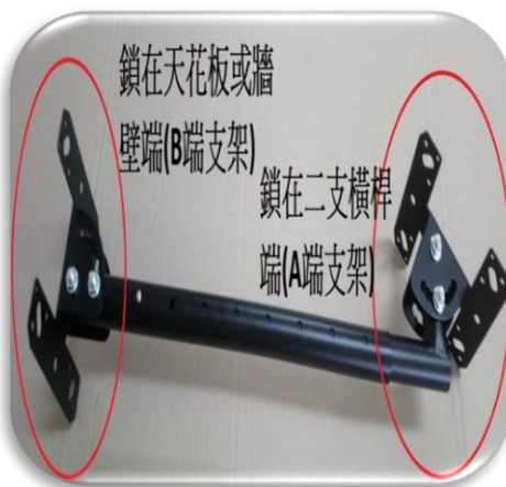
圖五、支架A端鎖在橫桿, B端鎖在天花板或牆壁