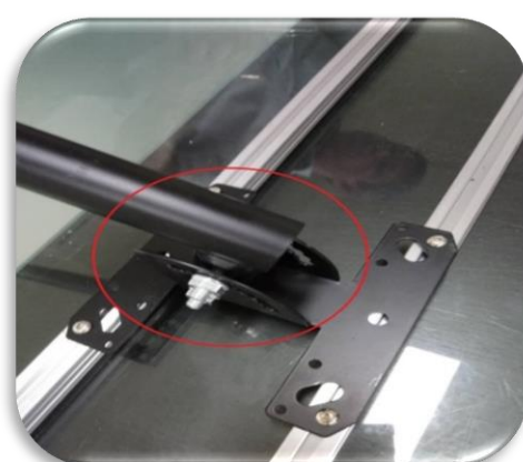
圖九、黑色A端支架螺絲取出可調整角度