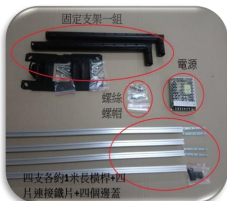
圖一、連板燈掛架零組件