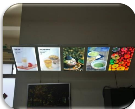
圖十四、掛上燈箱，完工