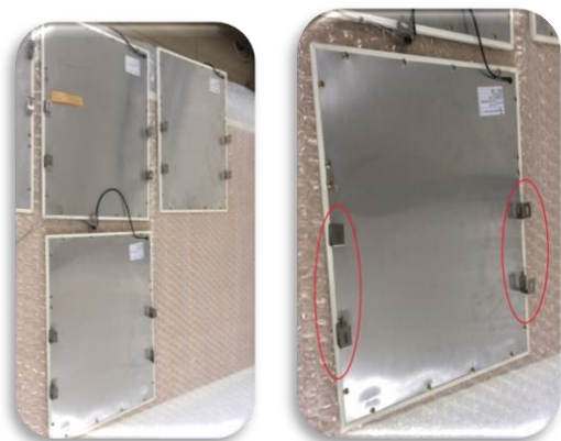
圖十三、將已裝好 U 型掛鉤的 燈箱依序放在圖十一橫桿上