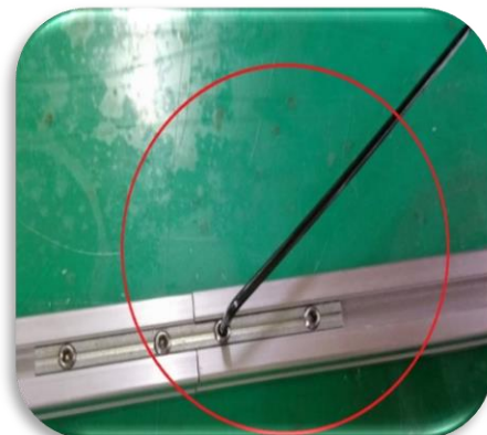
圖三、連接鐵片螺絲使用六角板手固定在橫桿