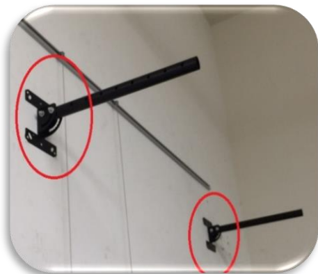
圖十、紅色框內 B 端支架 固定在天花板或牆壁適當